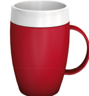
Becher mit Trink-Trick