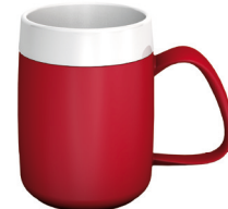
Becher mit Trink-Trick